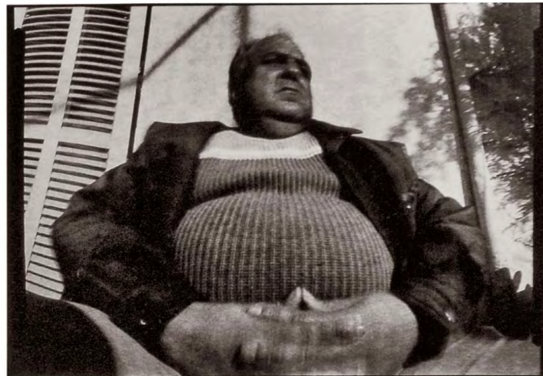
«T. Tolo» 1990 30 x 40 cm.