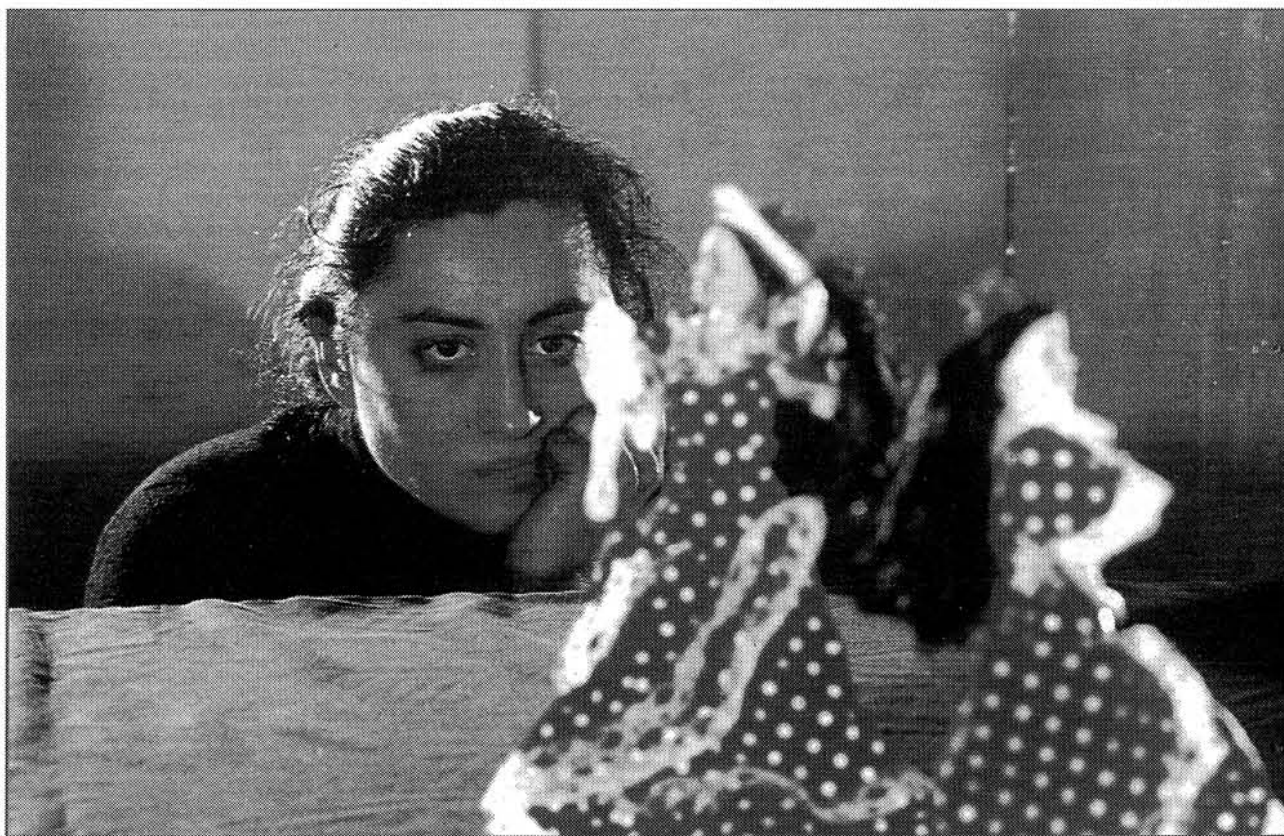
EXPOSICIÓN DE PILAR ALBARRACÍN "TOBE OR NOT TO BE".

El fotógrafo italiano Luigi Ghirri (Scandiano, 1943-Roncocesi, 1992) es aún poco conocido en España a pesar de que su obra ha sido publicada en numerosas revistas, especialmente de arquitectura (el había sido delineante) como Domus, Interni, Ottagono, etc., y otras de carácter general como Time-Life. Sus fotografías buscaban siempre el aspecto arquitectónico del paisaje y sus construcciones. Muy conocidas son sus series sobre los palacios de Versalles. Participó en la Documenta de Kassel y en la Biennial de Venecia. La exposición retrospectiva puede verse en el parisino Hôtel de Sully. Leopoldo Pomés (Barcelona, 1931) presenta en el Círculo de Bellas Artes de Madrid "Inclasificables", una amplia selección de sus obras con 95 fotos que recorren su trayectoria desde sus inicios en 1955 hasta 1997. Pomés, fotógrafo y publicista, es menos conocido en su faceta fotográfica que como publicista ya que algunos de sus anuncios forman parte de la historia de la publicidad en España (Terry, Freixenet...), con esta exposición, presentada en la Virreina de Barcelona y ahora expuesta en Madrid, se recupera su buen hacer como fotógrafo.