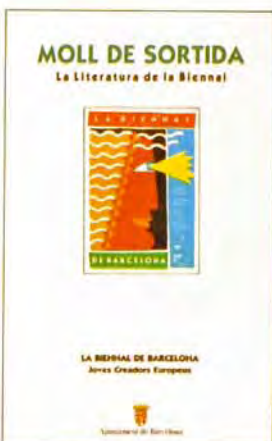
● Portada del llibre «Moll de Sortida».