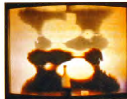
● Video de Ricard Arrufat.

Jean Claude Mocik. (Paris) «CIRCULATIONS»