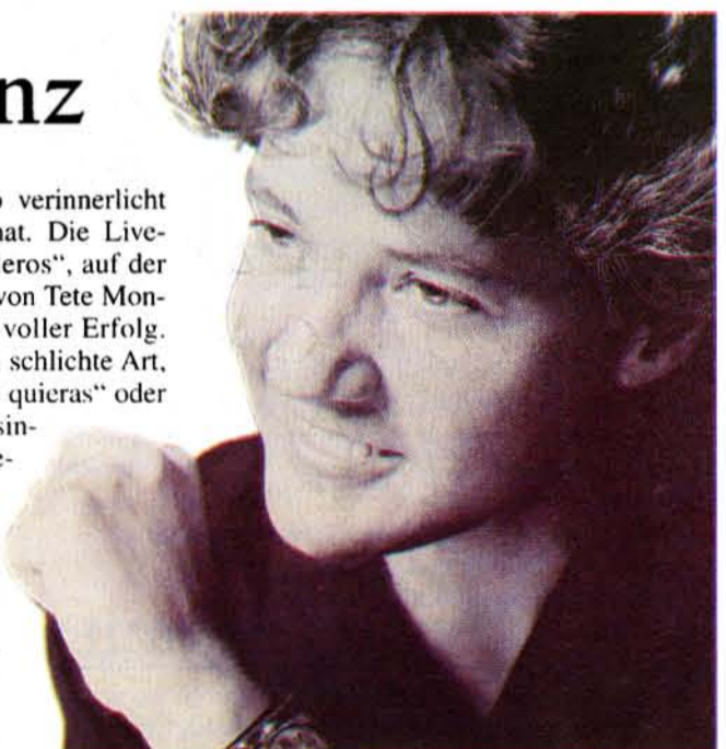
■ Mayte Martín.

■ Mayte Martín gibt am Freitag, 3. November ein Konzert im Gebäude der Sa Nost-rra-Stiftung, C/Concepció, 12. Beginn: 21 Uhr, Eintritt frei.